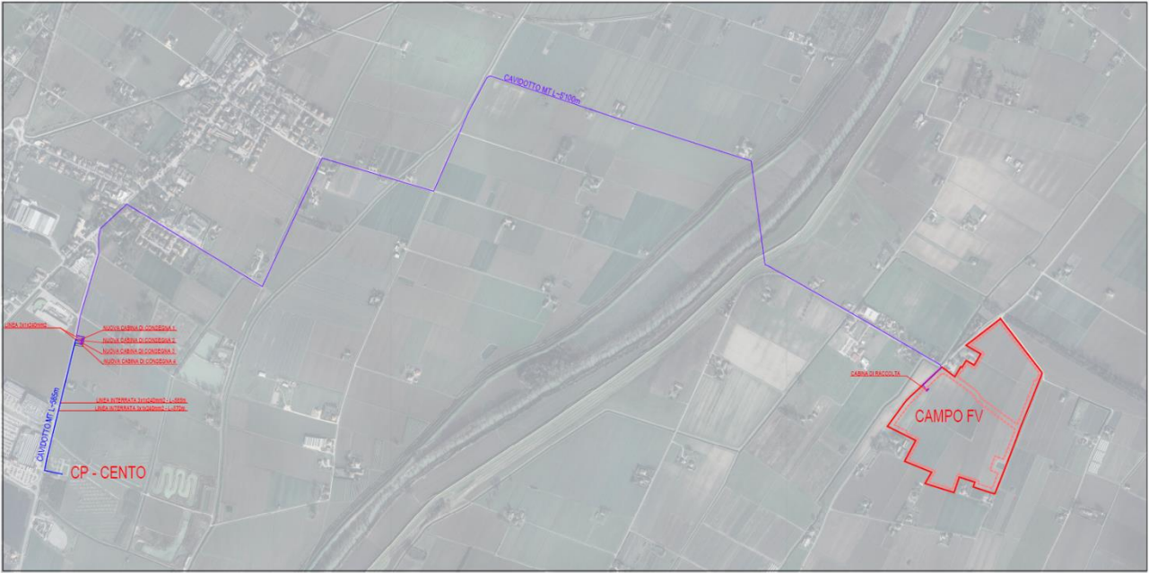
Figura 2: Inquadramento impianto e opere di connessione su ortofoto